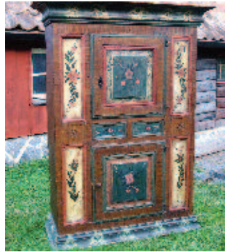
Ståndskåp, troligen målat av Rosmästaren, daterat PMS Åno 1766 MED, från norra Uppland.

Inga av Upplandsmålarnas möbler är signerade, så upphovsmännen har tilldelats anonyma benämningar. Här presenterar vi några av dem. Hans Wikström och dalmålarna rör sig över landskapsgränserna.