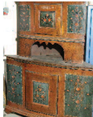
Tvådelat golvhörnskåp daterat 1824, troligen målat av Rosaren.

Treosmålaren dekorerade både skåp och interiörer och arbetade nästan genomgående med ett motiv, bestående av grupper med tre rosor. I målningsteknik och motivval står han Rosmästaren nära.