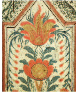
Detalj av skåp, målat av Mästaren med flamtulpaner.

Alundamästaren räknas som en av de skickligaste möbelmålarna i Uppland vars formspråk och målningsteknik är de tydligaste kännetecknen. Hans arbeten återfinns främst öster och nordöst om Uppsala, troligen bodde han i Alunda.