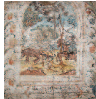
Väggmålning av Hans Wikström.

Roslagsmålarna var en grupp målare vars arbeten kännetecknas av starka och klara färger med en viss stramhet i de stiliserade motiven. En del av dem kan ha varit verksamma även på Åland vars måleri och allmogekultur uppvisar stora likheter med Roslagens.