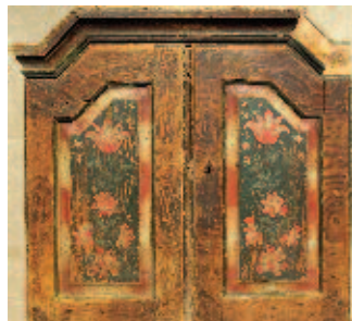
Överskåp, daterat IDS 1770 målat av Alundamästaren.