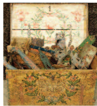
Kista daterad AMD Åno 1785, målade av en Roslagsmålare.

Mästaren med flamtulpaner står Alundamästaren mycket nära och var kanske elev och medhjälpare till denne. I vissa fall är det svårt att avgöra vem av dem som målat, men han skiljer sig främst från Alundamästaren genom sitt kraftfulla och mer expressiva måleri. Till exempel är bladverken tätare och svänger mer. Karakteristiska är även hans eldtungliknande flamtulpaner. Han var en av de mest produktiva målarna.